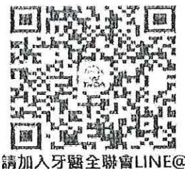
請加入牙醫全聯會LINE@