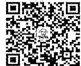
請加入牙醫全聯會LINE@