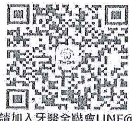
請加入牙醫全聯會LINE@