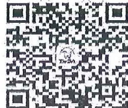
請加入牙醫全聯會LINE@