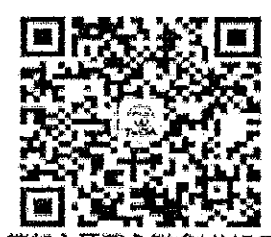
請加入牙醫全聯會LINE@