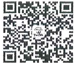
請加入牙醫全聯會LINE@