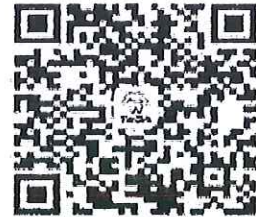
請加入牙醫全聯會LINE@