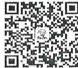
請加入牙醫全聯會LINE@