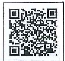
醫事人員戒菸服務訓練系統

正本：各縣市牙醫師公會、臺灣家庭醫學醫學會、臺灣牙周病醫學會、中華民國醫院牙科協會、中華民國家庭牙醫學會、中華民國植牙醫學會、臺灣植牙醫學會、臺灣福爾摩沙植牙學會、臺灣亞太植牙醫學會、中華民國臨床植牙醫學會、中華民國口腔植體學會、臺灣牙醫植體醫學會、臺北市牙科植體醫學會、臺灣美容植牙醫學會、臺灣口腔臨床植體學會、中華民國齒顎矯正學會、中華民國口腔顎面外科學會、中華民國口腔病理學會